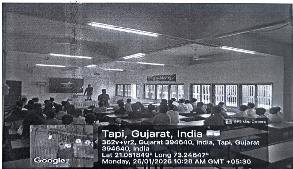
Students actively participating in hands on idea generation activities