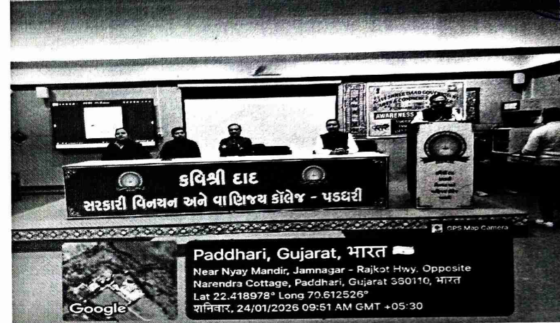
Paddhari, Gujarat, भारत Near Nyay Mandir, Jamnagar - Rajkot Hwy, Opposite Narendra Cottage, Paddhari, Gujarat 360110, भारत Lat 22.418978° Long 70.612526° शनिवार, 24/01/2026 09:51 AM GMT +05:30