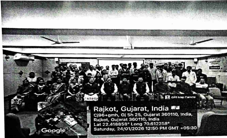
Rajkot, Gujarat, India Cj96+gmh, GJ Sh 25, Gujarat 360110, India Rajkot, Gujarat 360110, India Lat 22.418858° Long 70.612258° Saturday, 24/01/2026 12:50 PM GMT +05:30