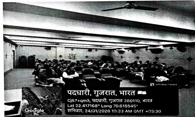
પદધારી, ગુજરાત, ભારત Cj87+qm3, પદધારી, ગુજરાત ૩૬૦૧૧૦, ભારત Lat 22.417168° Long 70.615545° શનિવાર, 24/01/2026 10:33 AM GMT +05:30