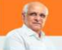
SHRI BHUPENDRA PATEL Hon'ble Chief Minister, Gujarat

“राष्ट्रीय उत्सव गुजरात की जलियाँ संकेत नहीं है। अर्थव्यवस्था को अर्थव्यवस्था, सामाजिक जीवन को विकास और समृद्ध बनाना है।”