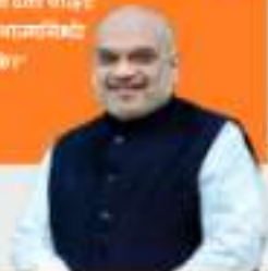
SHRI AMIT SHAH Union Home Minister & Minister of Cooperation Govt. of India

“राष्ट्रीय उत्सव एक जलियाँ संकेत नहीं है, यह भारत की सामाजिक और सांस्कृतिक अर्थव्यवस्था है। इसे लोकतांत्रिक जीवन का प्रतीक बनाना चाहिए। ताकि एक समृद्ध और सामाजिक अर्थव्यवस्था का विकास हो सके।”