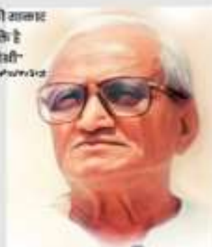
“देश पैस की सालार अनिवार्य है स्वदेशी” #swadeshi

‘स्वदेशोत्सव’ का महत्व केवल एक व्यापार मेले तक सीमित नहीं है, बल्कि संघ के पंच परिवर्तन में स्व को सशक्त कर समृद्ध और महान भारत के स्वप्न को साकार करने वाला एक व्यापक राष्ट्रीय पर्व है। उनका मानना है कि यह आयोजन न केवल स्वदेशी उत्पादों और नवाचारों को एक विशाल मंच प्रदान करता है, बल्कि यह हमारी समृद्ध सांस्कृतिक विरासत, पारंपरिक ज्ञान और अंतरिक्ष जैसे अत्याधुनिक क्षेत्रों में बढ़ते स्टार्टअप सहित आधुनिक औद्योगिक प्रगति के बीच एक महत्वपूर्ण नेतृत्व का काम भी करता है। स्वदेशोत्सव एक ऐसा सशक्त साधन है जो भारत के चरमवी प्रधानमंत्री श्री नरेंद्र मोदी जी के ‘local for vocal’ से भारत फर्स्ट की भावना को जन-जन तक पहुंचाता है, स्थानीय उद्यमिता को बढ़ावा देता है, और देश के आर्थिक उचावचलन के साथ-साथ राष्ट्रीय गौरव को भी सुरक्षित करता है, जिससे भारतीय समाज और अर्थव्यवस्था दोनों भविष्य की ओर एक सामूहिक और प्रेरणादायक कदम बढ़ाते हैं।