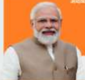
SHRI NARENDRA MODI Hon'ble Prime Minister

“राष्ट्रीय उत्सवों के लिए संकल्प होना हमारे जीवन का सच बनना चाहिए। नितान्त प्रकाश हम लोकतांत्रिक जीवन का इस्तेमाल करते हैं, हमारी अर्थव्यवस्था उत्तम ही समृद्ध होगी।”